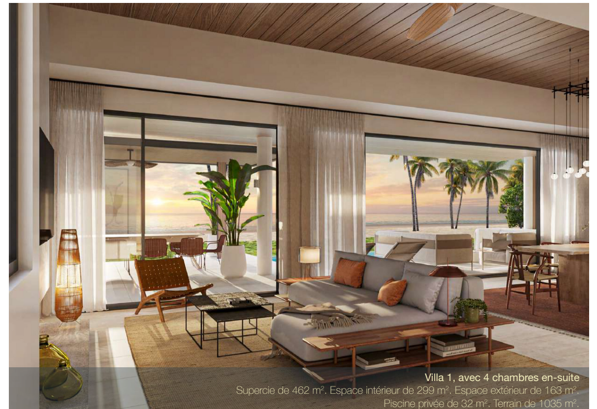
Villa 1, avec 4 chambres en-suite Superficie de 462 m 2 . Espace intérieur de 299 m 2 . Espace extérieur de 163 m 2 . Piscine privée de 32 m 2 . Terrain de 1035 m 2 .