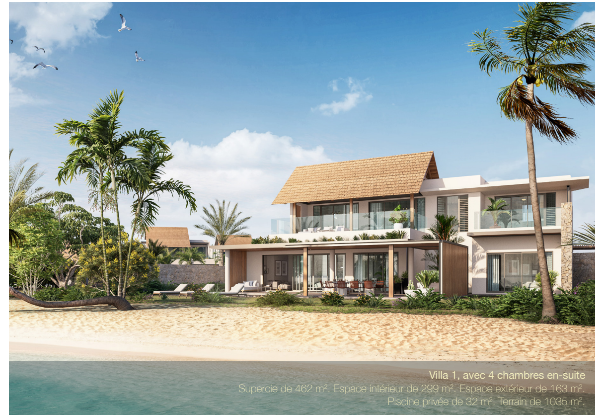
Villa 1, avec 4 chambres en-suite Superficie de 462 m 2 . Espace intérieur de 299 m 2 . Espace extérieur de 163 m 2 . Piscine privée de 32 m 2 . Terrain de 1035 m 2 .

Pour ceux qui seraient continuellement à la recherche de la perfection dans ses moindres détails, nous avons également créé la Villa 1 qui s'inscrit divinement bien dans cette réalisation avec un sens aiguisé du détail. Cette prouesse immobilière vous fait découvrir l'exceptionnel, l'unique. L'ambiance signée par un architecte d'intérieur ainsi que le niveau de prestations exceptionnel sont au service d'une prouesse architecturale élégante et contemporaine. Face au lagon et au Morne, avec un accès direct à la plage, la Villa 1 et ses 4 chambres à coucher en font une opportunité immobilière rare à l'Île Maurice